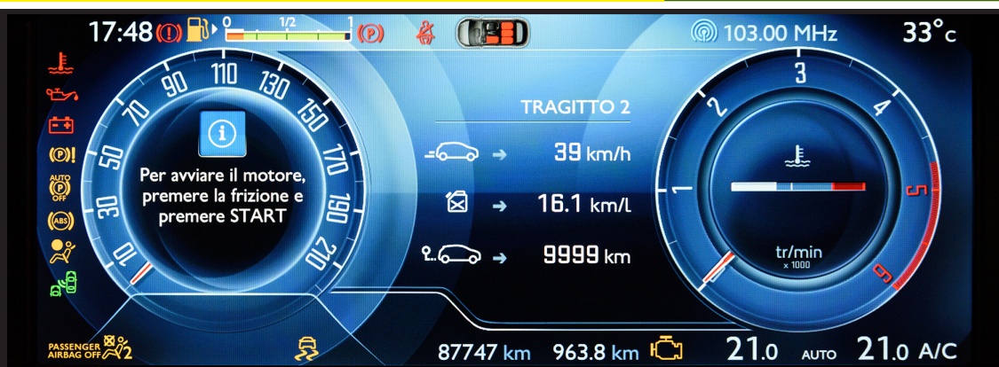
In foto: quadro strumenti digitale di una Citroen C4 Picasso al momento dell'accensione.